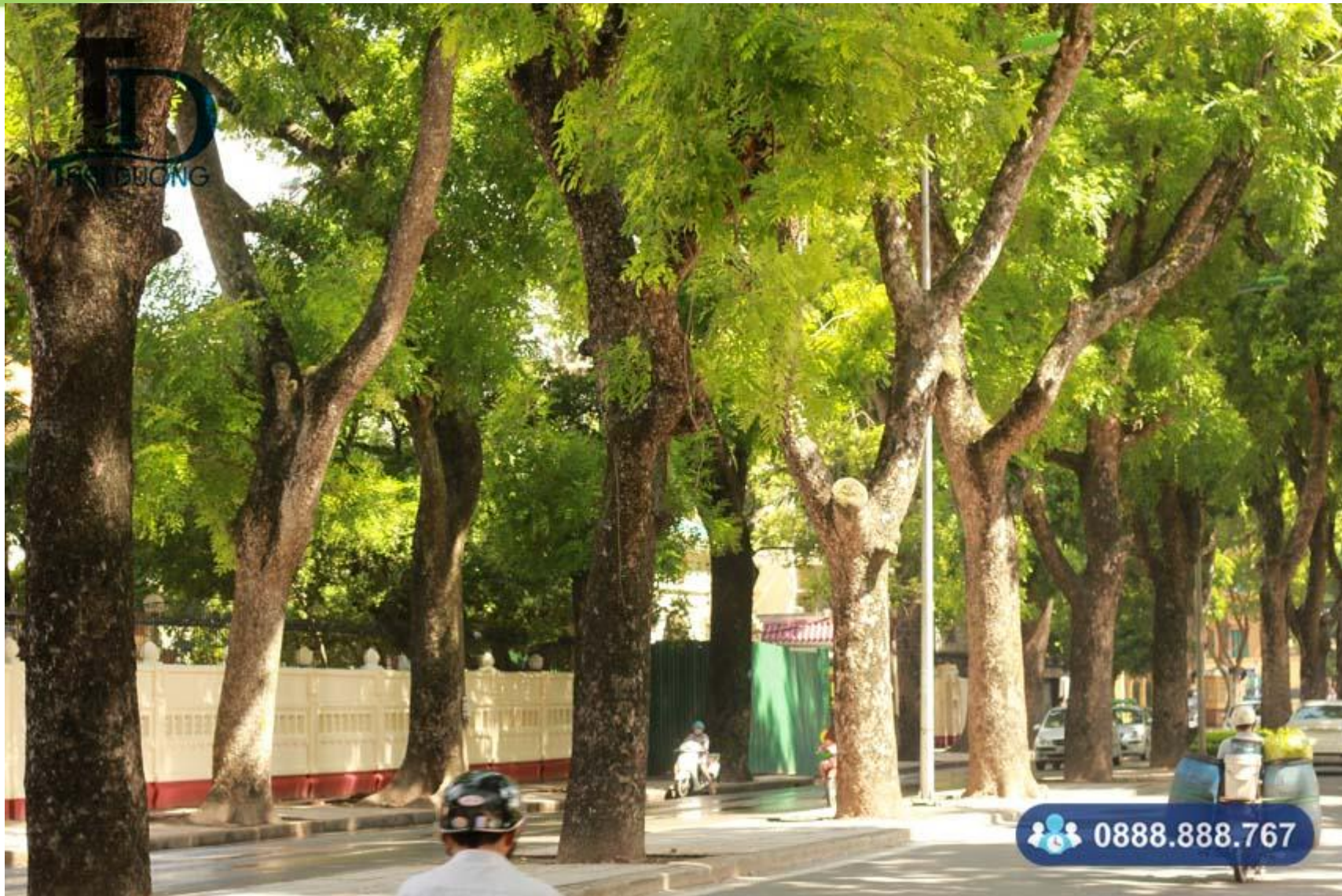
Cây xà cừ